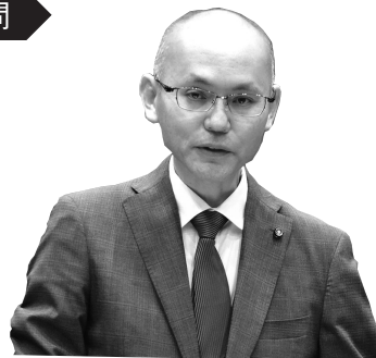
内藤 幹夫 議員