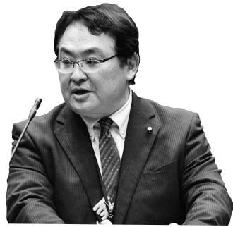
高瀬 重嗣 議員