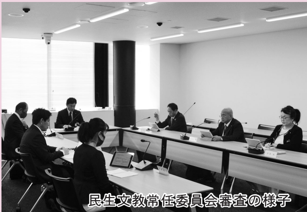
民生文教常任委員会審査の様子