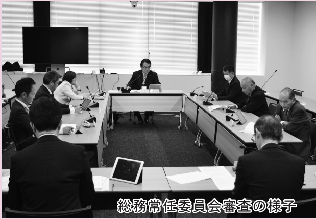
総務常任委員会審査の様子