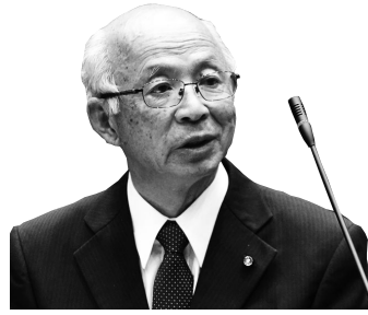
滝田 一郎 議員