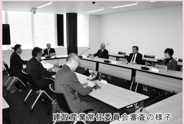
建設産業常任委員会審査の様子