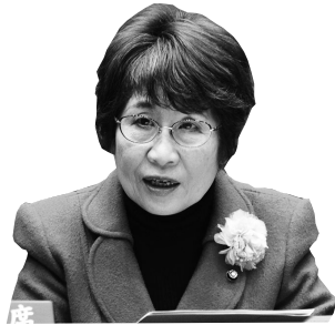
秋山 幸子 議員

業などです。社会保障関係費の 増加に加え、物価高騰による各 種委託料の増加の影響もあり、 歳入予算の見積りに対して歳出 予算の要求額が大幅に上回って いる状況です。既存事業も含め 事業の取捨選択を行い、財政健 全化と市民サービスのバランス を考慮しつつ、将来にわたり持 続可能な財政基盤を確立するた めの予算編成に努めます。