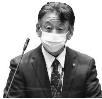
菊池 久光 議員