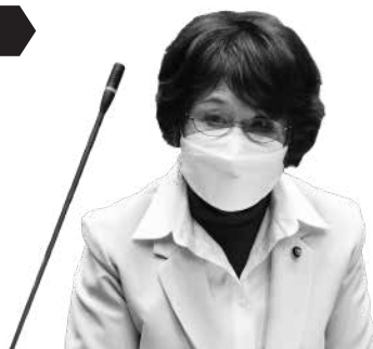
秋山 幸子 議員