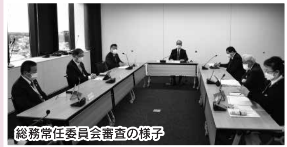
総務常任委員会審査の様子