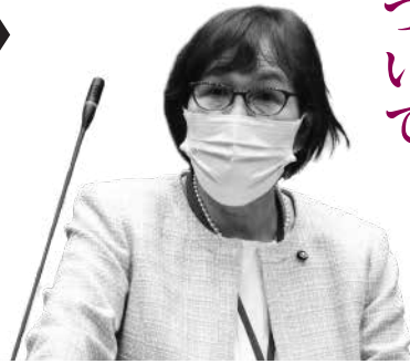
大豆生田春美 議員