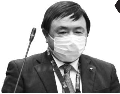
菊地 英樹 議員