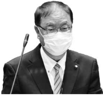
齋藤 光浩 議員