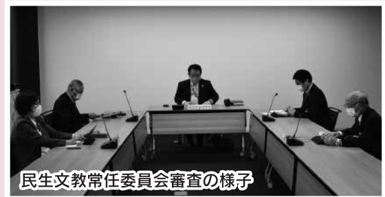
民生文教常任委員会審査の様子