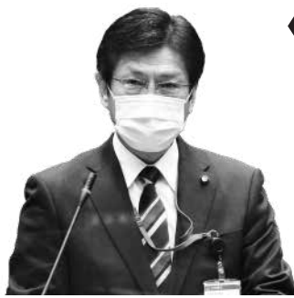
大塚 正義 議員