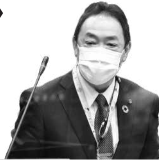
中川 雅之 議員