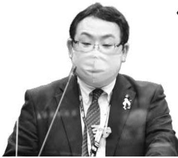
高瀬 重嗣 議員