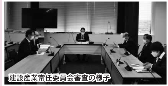
建設産業常任委員会審査の様子