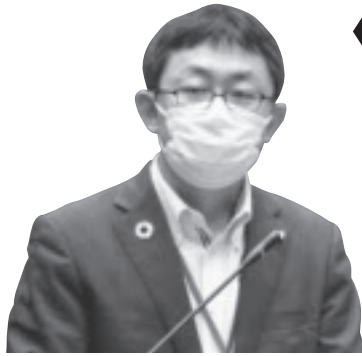
星 雅人 議員