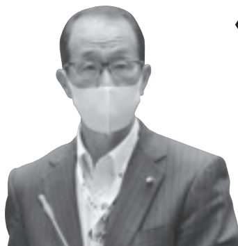
櫻井 潤一郎 議員