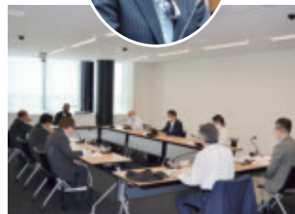
建設産業常任委員会審査の様子