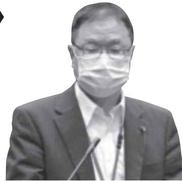
齋藤 光浩 議員