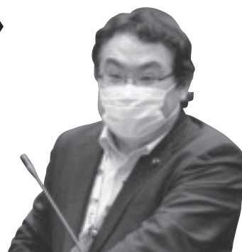
高瀬 重嗣 議員