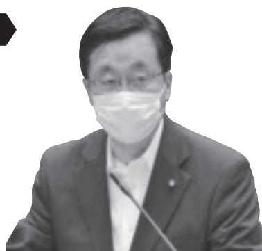
鈴木 隆 議員