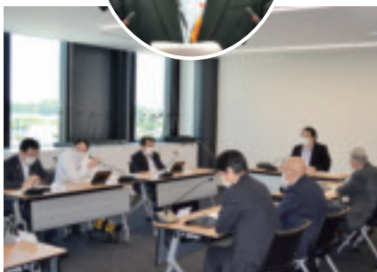
総務常任委員会審査の様子