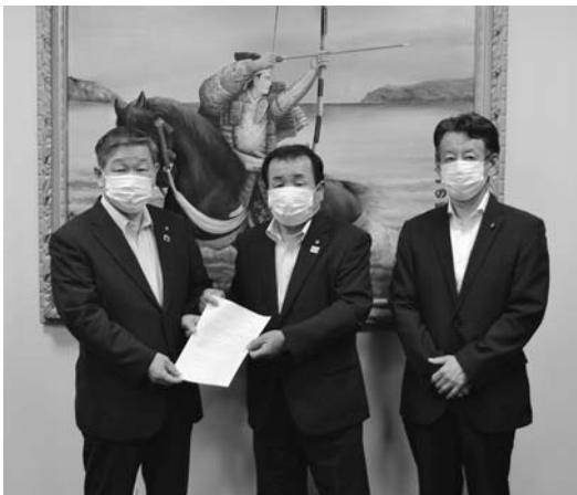
議長及び副議長から市長へ提出

大田原市議会では、6月に行われた定例会（最終日）において議員案第2号として可決した議員報酬削減による費用について、新型コロナウイルス感染症に影響を受けた市民生活の安全・安心を守るため、活用されるよう議長から市長へ申し入れを提出しました。今後とも議員一同、市民の皆様により添った議会活動に努めてまいります。