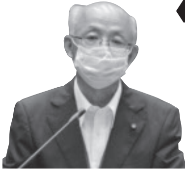
滝田 一郎 議員