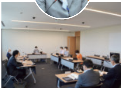
民生文教常任委員会審査の様子