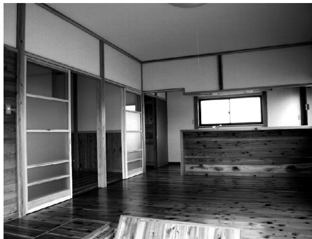
八溝材の香りとぬくもりが漂うモデルハウス室内