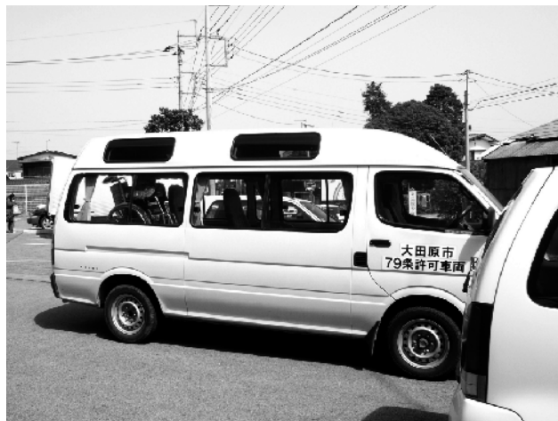
外出支援事業に使われている福祉車両

であります。併せて生ごみの処理における水切りの徹底を周知し焼却費用の軽減を図ってまいります。また、デポジット制度については、容器包装リサイクル法により回収・運搬・中間処理が市町