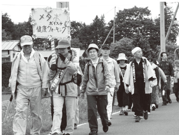
健康ウォークが開催されました

本市が行う事業仕分けは、今回二十程度の事業を予定しており、現在選定中であります。一事業当たり三十分とし、事業説明に五分、委員からの質問や議論に二十分、最後の評価、結果公表に五分の時間を考えております。また十人の委員の事前研修会を十月中旬、担当職員の説明会は九月下旬に予定しているところであります。 県内の事業仕分け実施状況につきましては、前年度に足利市が「構想日本」の協力を得て実施し