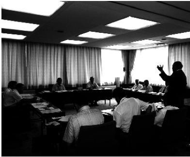
議会改革の方向性を問う質疑応答が交わされた観音寺市議会視察にて

条例の制定に当たっては市民の声を聞く会、執行部の質問権などを制度化するなど、議会の使命を分かりやすい言葉で明示するなど、議会改革と活性化に取り組んでいる。