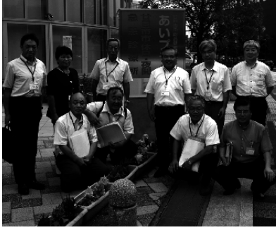
廿日市市あいプラザにて

このセンターは保健、福祉、子育ての各事業がひとつの建物の中で全て行われており、合理的である。市民もそれぞれの目的に合わせて活動しており、社会福祉活動、健康づくりの拠点施設として事業展開をしている。