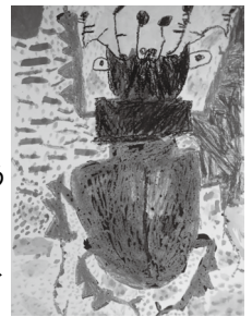
令和4年度年長児最優秀賞作品▶