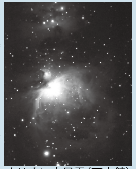
オリオン大星雲(天文館)