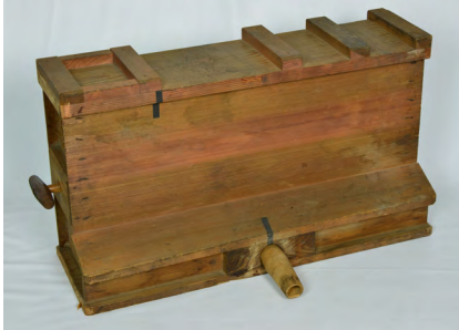
鞆(歴史民俗資料館所蔵)

資料一つ一つは独立したモノでも、この鞆のように、背景にある情報から繋がる情報があります。こうした積み重ねによって、地域の歴史がみえてくるのです。