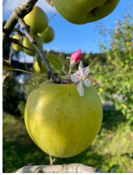
取材先の農園にて