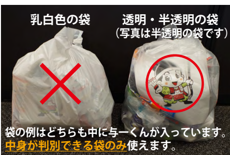
袋の例はどちらも中の一くんが入っています。中身が判別できる袋のみ使えます。

Q どのような袋で出したら良いですか。 A はがしづらいものは無理にはがさずに、そのまま容器包装プラスチックで出してください。 Q 容器包装プラスチックは、切って出してもいいですか。 A 切る、つぶすなどして形を変えても問題ありません。ただし、まとめるためのひもや輪ゴムなどは異物となりますので、使用しないでください。