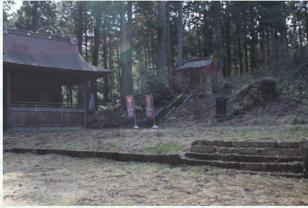
相撲大会会場跡地(大宮温泉神社内)

れていました。当時の様子を今に示す「番付表」や「化粧まわし」などが、地域内で保管されています。なお、「番付表」は、現在、大宮温泉神社(中野内)において保管されています。