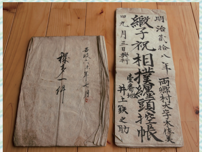
明治28年に開催された相撲大会の賛助金帳簿など