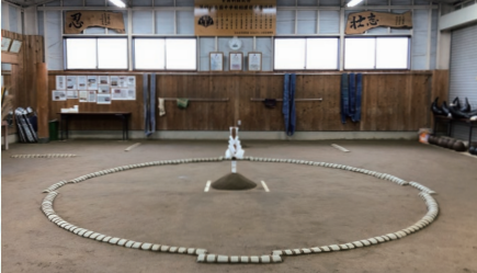
若草中学校相撲場 (相撲道場「おたわら修志館」稽古会場)