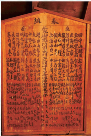
昭和8年に奉納された地域住民の力士たちの番付表