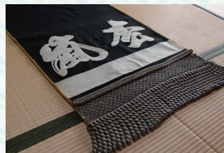
当時の「化粧まわし」

その後、昭和55年に開催された「栃の葉国体」において、黒羽地区(旧黒羽町)は、相撲競技の会場となり、栃木県代表チームの取り組みでは、会場が大いに沸き立ちました。