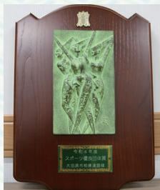
スポーツ優良団体賞受賞を証す櫃(市相撲連盟所有)

また、大田原市相撲連盟の活動が評価され、県スポーツ協会より、スポーツ優良団体賞が授与されました。