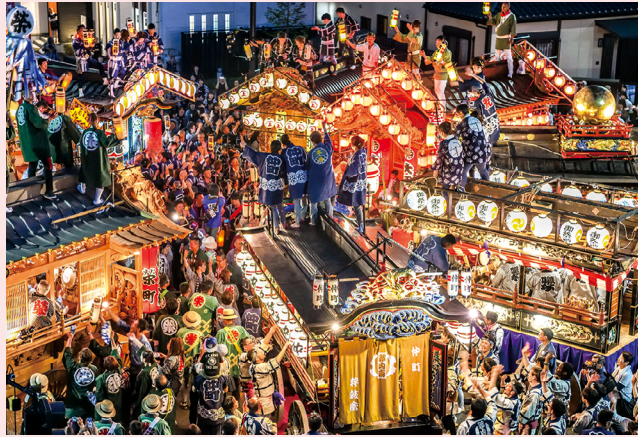
大田原屋台まつり

黒羽城址公園や芭蕉の広場、大宿街道などで桜が咲き誇り、散策スポットとして多くの観光客で賑わいます。那珂川沿いにある桜の馬場公園では夜間ライトアップも行われます。