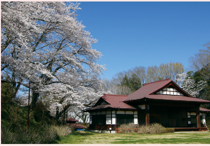
芭蕉の里くろばね桜まつり

龍城・龍頭公園の約400本のソメイヨシノが咲き誇ります。土日に様々なイベントを開催し、ライトアップも行われ、夜桜見物が楽しめます。