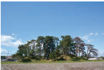
現在の下侍塚古墳

今回当館では、11月20日⑩まで、第30回秋季特別展「日本考古学発祥の地・徳川光圀発掘330年を記念して」を開催しています。古代から現代まで、湯津上の史跡の姿を史料と共に追います。ぜひご来館ください。