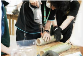
湯津上中学校の竹灯籠づくり

その他の活動としては、なかがわ水遊園周辺の清掃活動や湯津上中学校の竹灯籠づくりなど地域活動へ参加させていただきました。大田原市の魅力を改めて発見することに嬉しさを感じております。