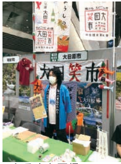
ふるさと回帰フェア

普段は、移住定住交流サロンで移住定住総合案内に関する活動を行っておりますが、9月25日に東京国際フォーラムで開催された「ふるさと回帰フェア」に大田原市として出展し、移住相談を実施してきました。当日は、他の自治体の移住コーディネーターや地域おこし協力隊とも交流させていただきました。大変有意義な経験をさせていただきました。また、来場された多くの方を通じ、『移住』への関心の高さを感じました。最近、電話やメールでの相談が多かったため、直接お会いして案内できたことで、より大田原市の魅力を伝えられたと思います。