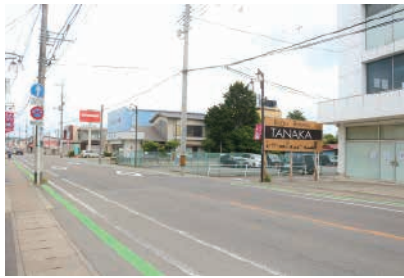
▲「福原道」の入口(新富町)

「福原道」は、大田原宿下町から那須家が陣屋を置いた福原地区を結んでいた道です。「福原道」という名称は「おたわらじやくえす」という名称は「おたわらじやくえす」に見えますが、正式名称ではなく、大田原宿から福原に向かう道、という意味で表記されています。事実「おたわらじやくえす」には、「鳥山への道、荻野目村・川下村へ」の道として描かれています。