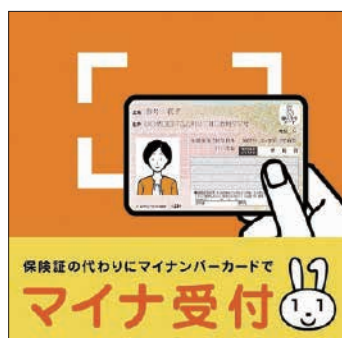
▲「マイナ受付」ステッカー 「マイナ受付」ポスター