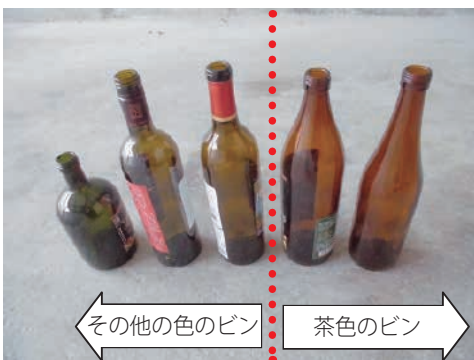
その他の色のビン

・ガラス製の容器で、中身の無い状態で販売されている物(梅酒を漬ける容器など)は、ビンではなく、ガラス類に分別してください。