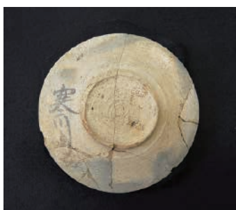
小松原遺跡墨書土器「寒川」 (大田原市教育委員会)

今回当館では、那珂川館・湯津上館の2館に分けて7月9日(土)から8月28日(日)まで、巡回展「栃木の遺跡」を開催します。近年の県内の発掘調査の速報展で、当市の小松原遺跡のほか、関連すると思われる墨書土器「寒厨」(小山市出土)なども展示する予定です。ぜひご来館ください。