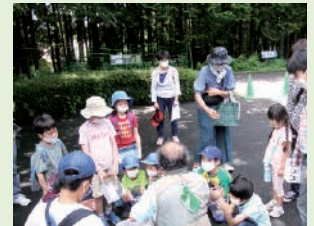
昨年のクワガタ教室