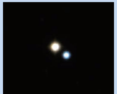
アルビレオ(天文館)