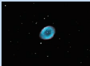
M57惑星状星雲(天文館)

こと座にある惑星状星雲で、その形からリング星雲・ドーナツ星雲などの呼び方があります。環のように見えるのは、星がその寿命を終えるとき放出したガスで、それが環のように広がったためにこのような形になっています。夏から秋にかけて見ることができ、人気のある天体です。