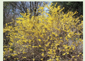
3月中旬のレンギョウ

早春の花が咲きだすと、ふれあいの丘は一気に華やいだ雰囲気になります。花を愛で、小鳥のさえずりを聞いてリフレッシュしてください。