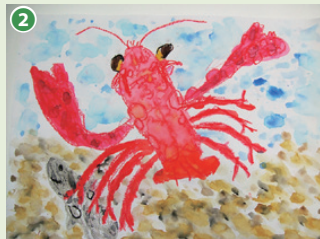
【年中の部】写真② くろばね保育園 やまがみなさん