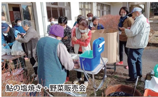
鮎の塩焼き・野菜販売会