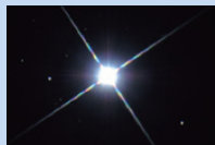
シリウス（天文館撮影）

夕方6時を過ぎたころ、南東の空に一段と目立つ星が昇ってきます。おおいぬ座のシリウスです。全天で最も明るい恒星で、オリオン座の三つ星を下にたどっていくと探し当てることができます。非常に明るいので、街中でも肉眼で見つけることができます。シリウスの他にも、カペラ（ぎょしゃ座）やベテルギウス（オリオン座）、プロキオン（こいぬ座）など、冬の夜空にはたくさんの明るい星（1等星）があります。また、プレアデス星団やヒヤデス星団（両方ともおうし座）など星の集まりや、星の誕生する場所オリオン大星雲など、見どころがたくさんあります。寒さの厳しい季節ですが、ぜひ天文館の望遠鏡で冬の夜空をお楽しみください。