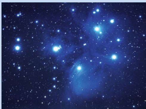
M45すばる（プレアデス星団）