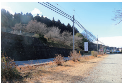
那須氏の陣屋があった場所 (現在は高台が削られ道路に)

福原は、とても歴史が深い地区です。例えば福原八幡宮は、天喜5(1057)年に源頼義・義家父子が創建したのがはじまりといわれ、鎌倉時代に整備された奥大道は、福原を通っていたといえます。福原地区の東側には、戦国時代の前期まで那須氏の居城があり、江戸時代には、現在の玄性寺付近に那須氏の本拠(陣屋)がありました。