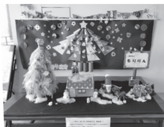
昨年度に展示した作品