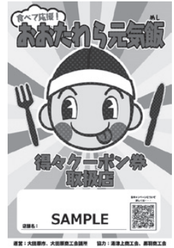
ポスター(イメージ)