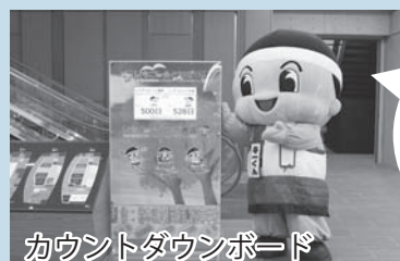
カウントダウンボード

国体開催までの残日数を表示するカウントダウンボードを那須清峰高等学校に制作していただきました。機械科、機械制御科、電気情報科、建設工学科、商業科の各学科の生徒が協力し、約半年かけて制作しました。