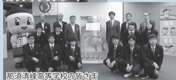
那須清峰高等学校の皆さま