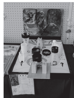
最優秀賞「妖怪飛ばスアレス」