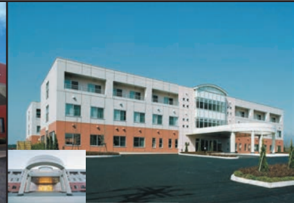
介護老人保健施設 同仁苑