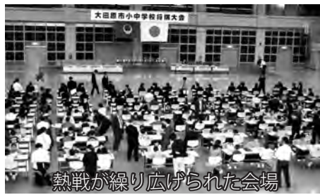
熱戦が繰り広げられた会場

リーグ戦は1対局20分、決勝トーナメント戦は小学校3年生から中学校2年生までは1対局30分、中学校3年生は、対局時計を使用し、持ち時間15分で行われました。 また、小学校6年生の準決勝と中学校3年生の決勝戦ではプロ棋士による大盤解説も行われました。