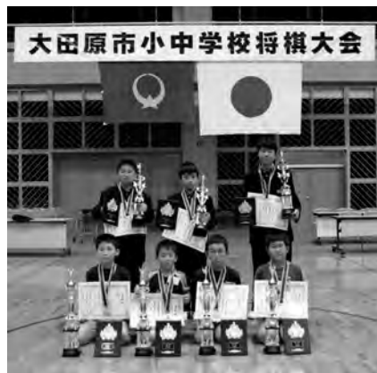
各学年の個人戦優勝者の皆さん