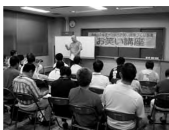
前期の「お笑い講座」