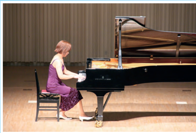
8月21日、22日 第17回マラソンコンサート (那須野が原ハーモニーホール 大ホール)

9月9日の「救急の日」を前に、救急医療と救急業務について広く知っていただくこと、心肺蘇生法や初期消火体験コーナー、大田原赤十字病院職員による健康相談コーナーなどが設けられました。心肺蘇生法の体験では、消防署員の指導を受けながら、いざという時のために真剣に取り組む参加者の姿が見られました。