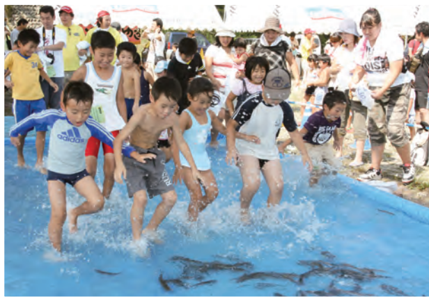
9月5日 こども祭りアユつかみ取り (那珂川河川公園 那珂川歩道橋下)

笑いを通した健康づくりを行う「お笑い健康づくり事業」の一環で、「お笑い健康ライブ」が開催されました。お笑い講座の受講生12組とプロのお笑い芸人3組が出演。講座受講生の皆さんは、講座の成果を存分に発揮し、プロ顔負けのネタを披露。会場には終始楽しい笑い声が響きわたりました。