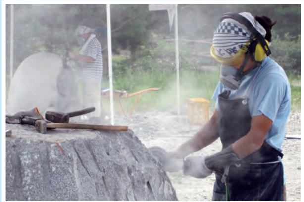
7月20日～8月31日 那須野が原国際彫刻シンポジウムin大田原2010公開制作 (大田原市ふれあいの丘)

平成6年度にオープンしたホールを身近に感じてもらうことを目的に毎年開催されているマラソンコンサート。17回目を迎えた今回は、2日間で小学生から60代まで104組119名の参加がありました。ピアノなどの楽器演奏や声楽など、参加したアマチュア音楽家は日ごろの練習の成果を披露しました。