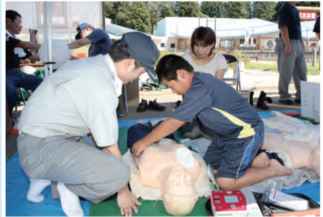
9月4日 救急フェア (道の駅那須与一の郷)

子供祭り実行委員会が、河川愛護精神の醸成と地域交流を図ることを目的として、アユのつかみ取りをはじめとしたさまざまなイベントを開催。イベント終了後には、イベントの参加者が那珂川の自然に感謝の意を込めて、河川の清掃活動を行いました。