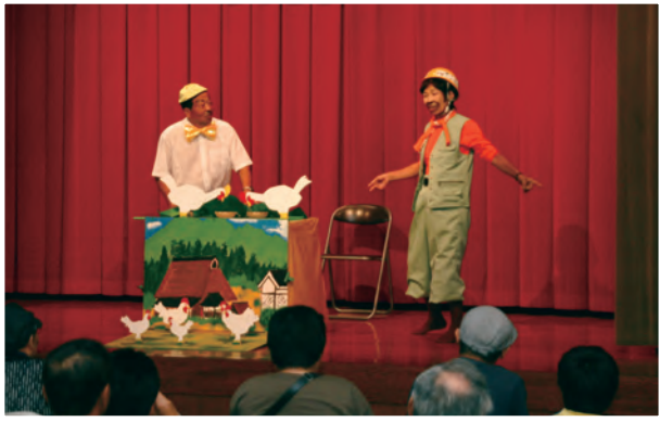
8月29日 平成22年度お笑い健康づくり事業 「お笑い健康ライブ」 (大田原地域職業訓練センター 講堂)

笑いを通した健康づくりを行う「お笑い健康づくり事業」の一環で、「お笑い健康ライブ」が開催されました。お笑い講座の受講生12組とプロのお笑い芸人3組が出演。講座受講生の皆さんは、講座の成果を存分に発揮し、プロ顔負けのネタを披露。会場には終始楽しい笑い声が響きわたりました。