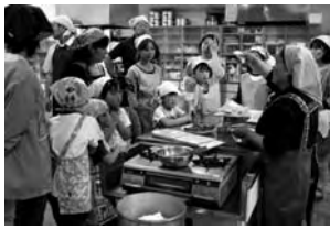
昨年のおやつ作り体験教室