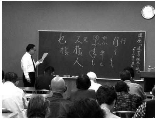
平成22年度の講座の様子

それを受け、本年度は「陸奥横断篇」と題して、次のような日程・内容で『おくのほそ道』を読んでいます。以前から続いて受講