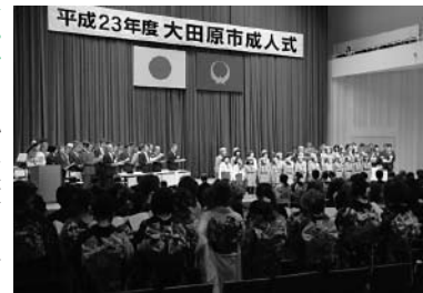
成人式での市歌斉唱