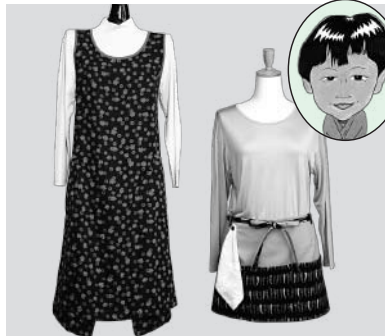
オーダーメイドエプロン 洋装やすだ