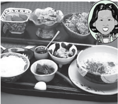
季節の食材を使用した家庭料理 家庭料理 夢実家