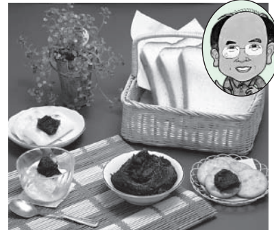
甘党の方へ 食べ方いろいろ 斎藤製餡所