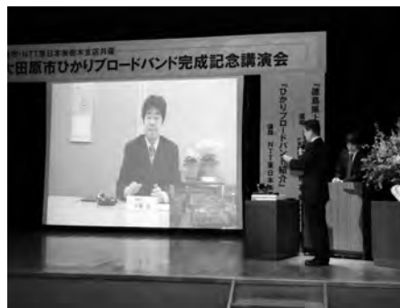
テレビ会議の実演