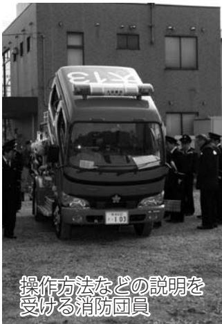
操作方法などの説明を受ける消防団員

消防団員の確保が当面の課題となる中、新型車両の導入は地域住民の安全・安心の確保に寄与することが期待されます。