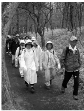
昨年の市民ハイキング

・定員に満たなかった場合は、定員になるまで随時(土・日・祝日を除く午前8時30分～午後5時)受け付け。