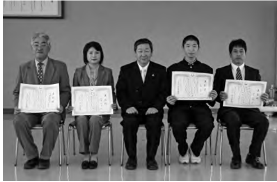
明るい地域づくり功労賞受賞者の皆さま

この功労賞は、各分野で市民の誇りとなる顕著な功績を挙げ、本市の名声を高めた個人または団体などの方々に授与されます。