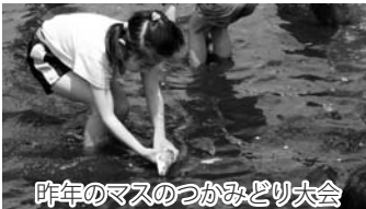
昨年のマスのつかみどり大会