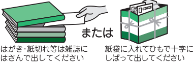
紙袋に入れてひもで十字にしばって出してください または はがき・紙切れ等は雑誌にはさんで出してください

の箱、レトルト食品の空箱やコピー用紙など『新聞(チラシ)』、『段ボール』、『雑誌』にも当てはまらないリサイクルできる紙。感熱紙、圧着紙、カーボン紙、写真、銀紙(ガムの包み紙など)はリサイクルできません。