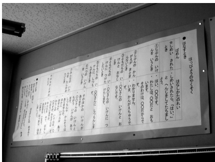
写真④ 日常の話し方・聞き方マニュアル（教室の壁に掲示）

「日常の話し方・聞き方マニュアル」（写真④）は低学年用、中学年用、高学年用があり、低学年は具体的にどう話すが示されており、高学年になるにつれ、自分のことばで話せるような工夫が見られます。