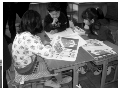
グループで話し合う児童