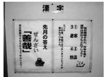
写真② 漢字コーナー

イズ形式で楽しく掲示した「漢字コーナー」（写真②）など、工夫されたコーナーが5カ所設けられています。