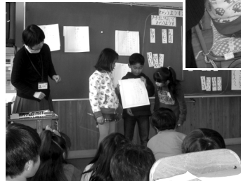
グループの意見を発表する児童