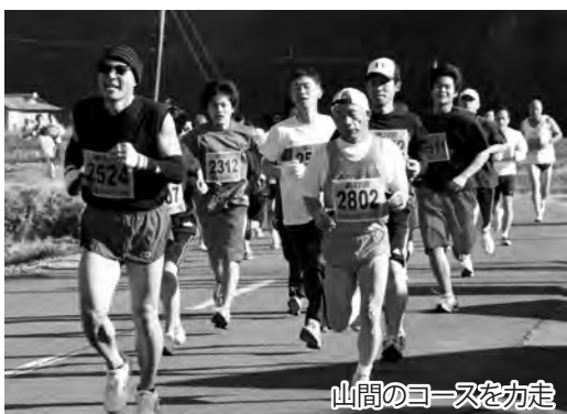
山間のコースを快走