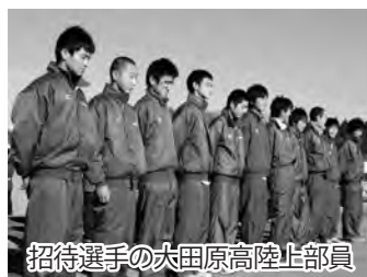
招待選手の大田原高陸止部員