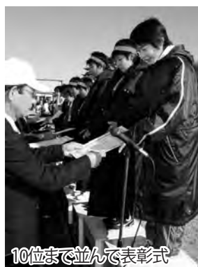
10位まで並んで表彰式