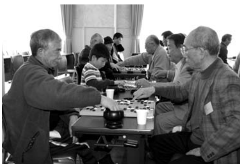
昨年の大会の様子

●参加費 1000円(昼食込み) ●申し込み 2月3日(水)までに、ふれあいの丘まで電話で申し込み。申し込み時に、経年数などを確認します。 ●申し込み・問い合わせ ふれあいの丘 TEL (28) 3131