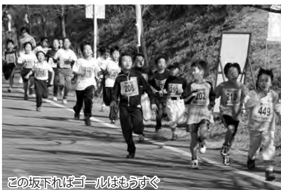
この坂下ればゴールはもうすぐ