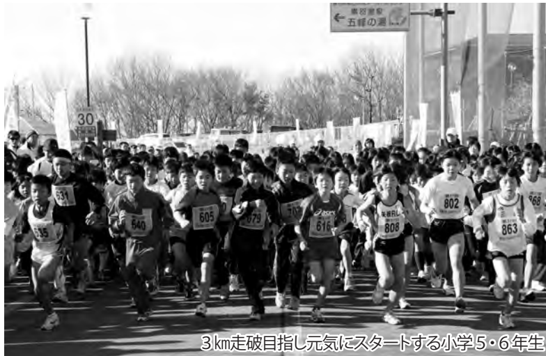
3km走破目指し元気にスタートする小学5・6年生