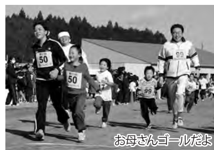
お母さんゴールだよ