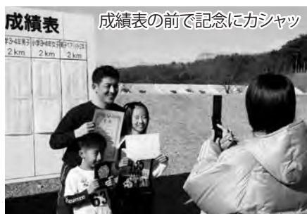
成績表の前で記念にカシャッ