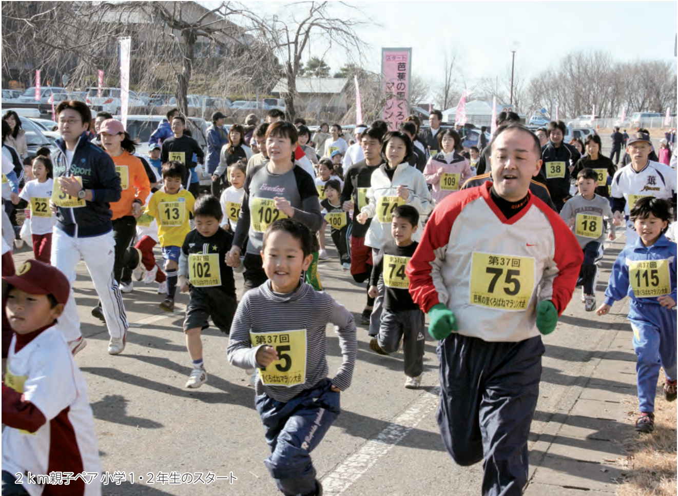
2 km親子ペア 小学1・2年生のスタート

12月23日（水・祝）、第37回芭蕉の里くろばねマラソン大会が黒羽運動公園をスタート・フィニッシュに開催されました。市内外からの参加者は2 kmから10 kmまで14種目に分かれて、師走の黒羽路を元気に駆け抜けました。（4～5ページに関連記事掲載）