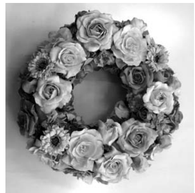
クレイフラワー作品例