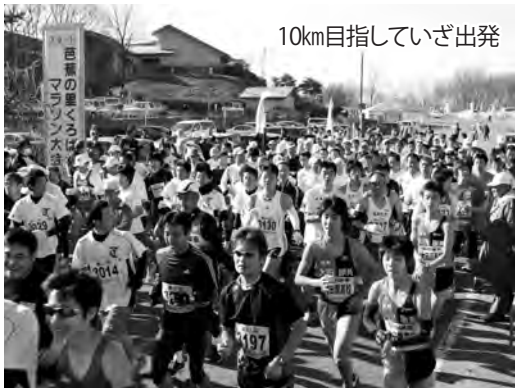
10km目指していざ出発

12月23日（水・祝）、天候は晴れ。黒羽運動公園を発着点とする恒例の「くろばねマラソン大会」。参加者は1,400名に達し、2~10kmのコースを年齢別・性別に設定された14のクラスで、それぞれの健脚を競いました。親子ペアのクラスでは、小さな子どもたちが懸命に走る姿がとても印象的でした。