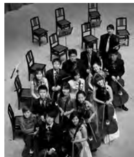
東京チェロアンサンブル

問い合わせ 那須野が原ハーモニーホール ☎(24)0880 大田原市本町1-2703-6 (9:00～17:00) 🌐 http://www.nasu-hh.com/