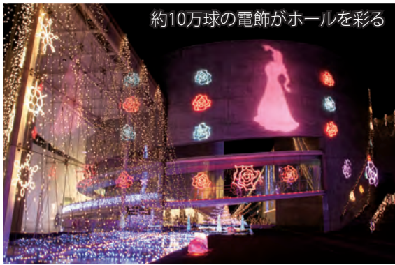
約10万球の電飾がホールを彩る