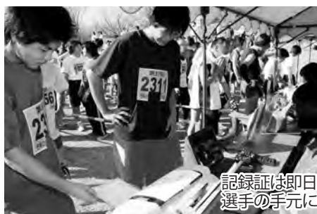
記録証は即日選手の手元に