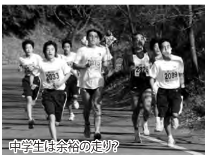
中学生は余裕の走り?