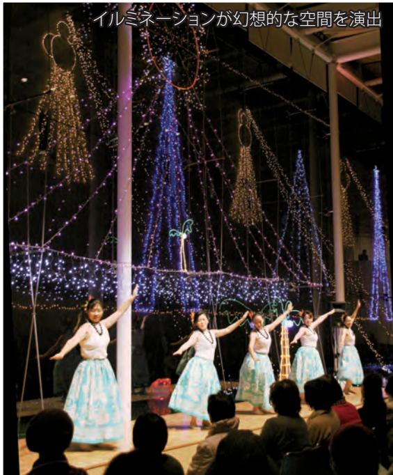
イルミネーションが幻想的な空間を演出

凍てついた夜を赤・黄・青などさまざまな色で彩るイルミネーション。そして、開放的でゆったりと流れる南国のリズムに合わせて繰り広げられるフラダンス。400名もの観客は、時の流れを忘れ、しっとりと酔いしれたひとときを楽しみました。