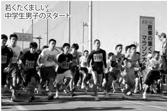
若くたくましい 中学生男子のスタート