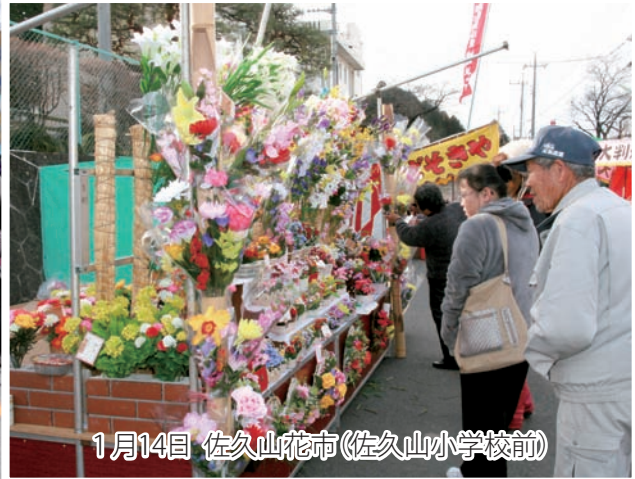
1月14日 佐久山花市(佐久山小学校前)