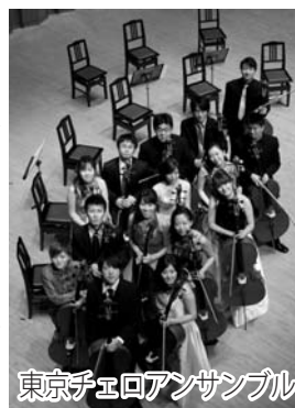
東京チェロアンサンブル