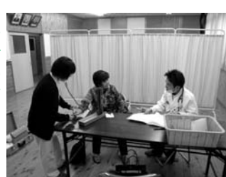
須賀川出張所での診療の様子

※事前に、日赤のへき地巡回診療担当医師による受診可否の判断が必要になります。 ●その他 実際に診療の様子を見学されたい方は、お気軽に診療場所に来てご覧ください。