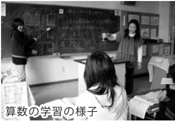
算数の学習の様子

本市すべての小・中学校の算数・数学の授業において、T・T（ティームティーチング）や少人数指導が可能になるよう、支援助手を配置しています。学級担任（教科担任）の先生と連携して児童（生徒）を観察することで、児童（生徒）のつまずきに早く気づき、支援できたり、課題学習では、グループによる少人数指導が可能となったりと、各学校で工夫して活動しています。