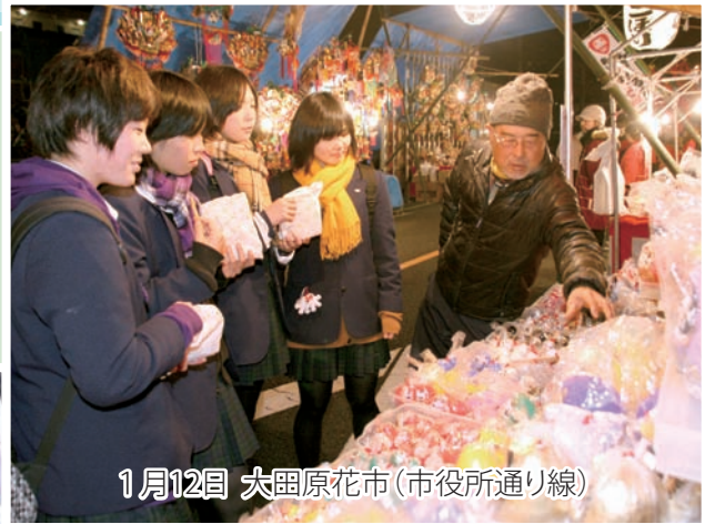
1月12日 大田原花市(市役所通り線)

縁起もののダルマや色鮮やかなお飾り、切り花、そしておいしそうな匂い漂う屋台の列。花市の会場はさまざまな色で彩られ、売り子の威勢のいいかけ声が飛び交います。市内では大田原、佐久山、黒羽の3地区で開催され、福を求めて大勢の市民が足を運びました。