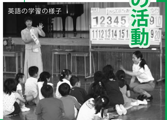
英語の学習の様子

本市は平成17年から英語教育特区に認定されました。小学校でも英語活動が可能となり、1年生から6年生まで英語を学習しています。英語の専門性のある英語活動指導員と学級担任が協力して指導に当たるため、児童たちに英語に興味をもってもらえるような活動が可能となっています。学習指導要領の改訂により、今後、小学校5・6年生は外国語活動として全国的に学習することになりますが、本市では、小学校1年生から4年生までも引き続き英語活動を行っていきます。