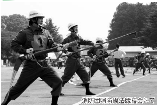
消防団消防操法競技会にて

自分が育ったまち、自分が暮らすまち、そして自分が働くまち。そんなかけがいのない、大切なまちを一緒に守りませんか。地域を知るあなただからできることがたくさんあります。