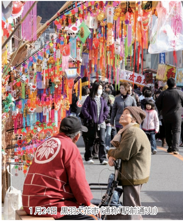
1月24日 黒羽大花市(通称「駅前通り」)