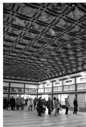
昨年の大田原市民号(永平寺)