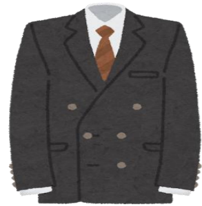
スーツ、Yシャツ、ネクタイ