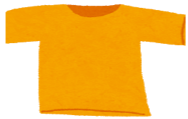
Tシャツ、ポロシャツ