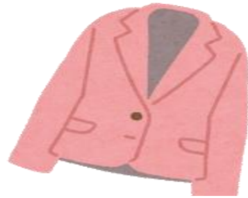
ジャンパー、ジャケット