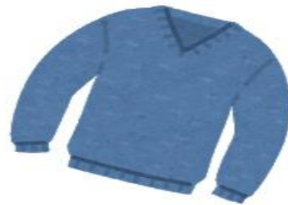
セーター、トレーナー