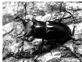
ミクラミヤマクワガタ

体長が3cm前後の小さなクワガタで、幼虫時代は腐葉土などの中で1～2年過ごします。成虫の期間は約1カ月と短く、ほとんど飛ばずに地上を歩いて移動します。