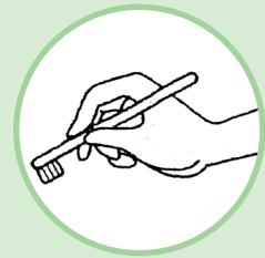
歯ブラシの持ち方